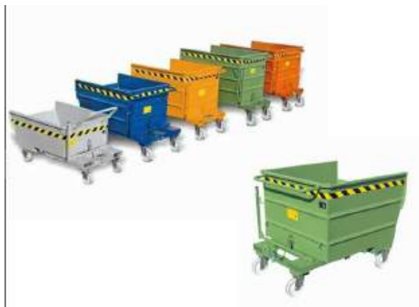
Cassonetti per la raccolta differenziata in uno dei cantieri

Nella gestione del cantiere, la ditta appaltatrice si deve attiene a tutte le prescrizioni stabilite dal norme tecniche ambientali , in relazione alla componente atmosfera-qualità dell'aria, al fine di utilizzare le più idonee procedure di mitigazione di impatto ambientale .