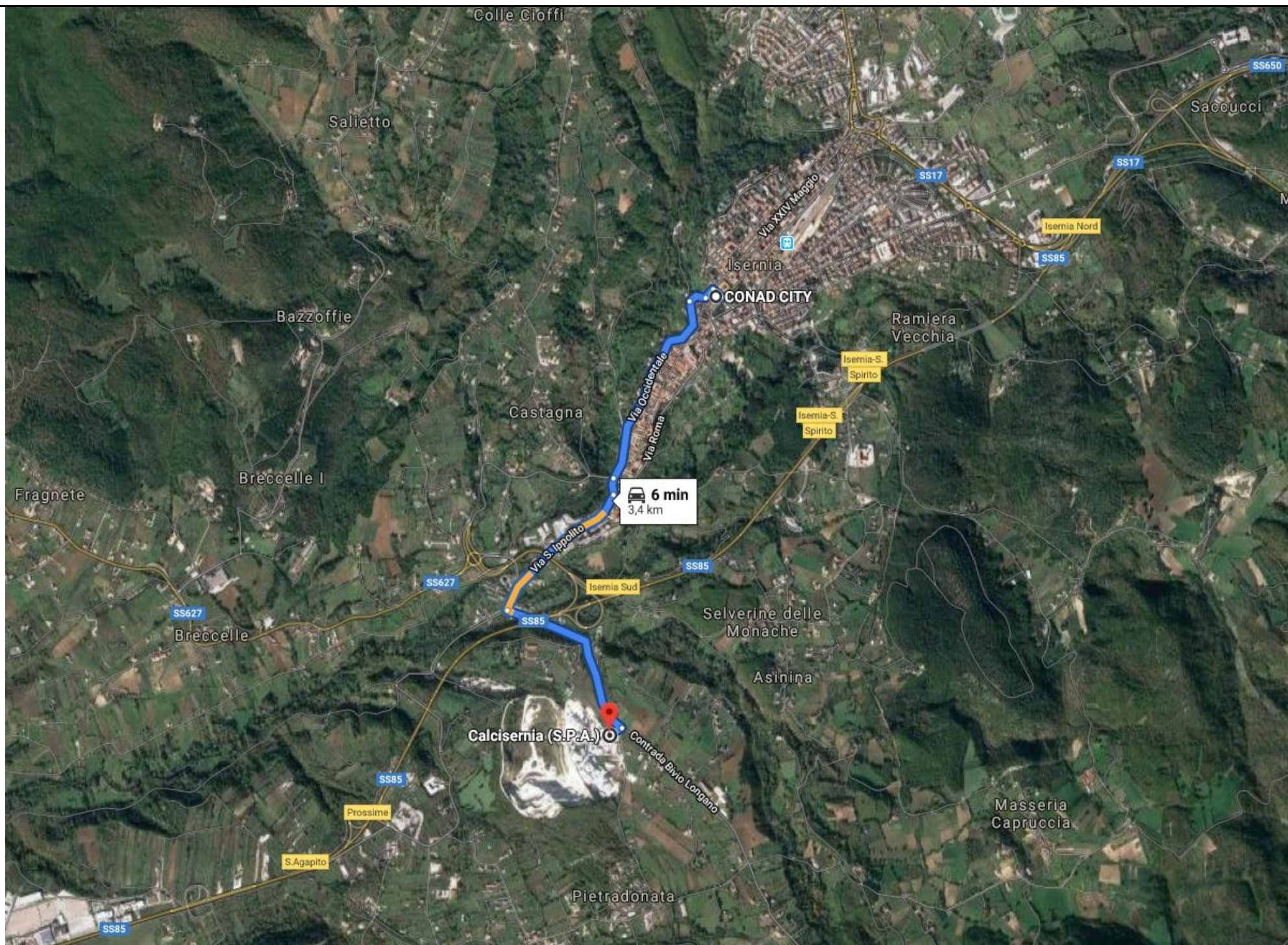
1. Planimetria con indicazione dei siti delle cave di smaltimento dei materiali edil